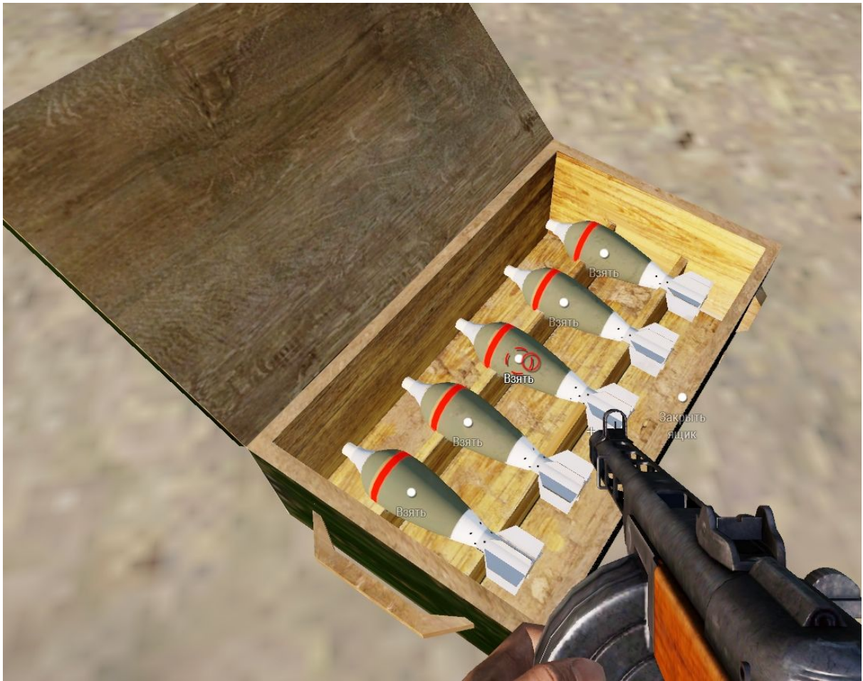
5. Зарядите миномёт